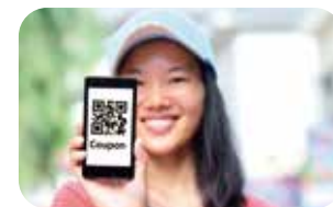
地元ボランティアやイベント情報に 気軽に参加できる仕組み! 参加ポイントを貯めて地元で還元

リノベーションして、観光案内所や宿泊施設、 富士・箱根・伊豆のアンテナショップなどに! 古くから営む商店にも活気をもたらします。//