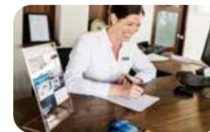
他言語対応のスタッフ